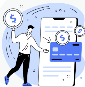
seus hábitos de consumo