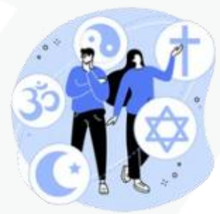
sua preferência religiosa

Agora fica fácil você compreender que o uso mal intencionado desses dados pode criar muitos problemas, como ocorre com os conhecidos golpes de boletos bancários, fraudes em contas de aplicativos, abertura indevida de contas bancárias e de consumo.